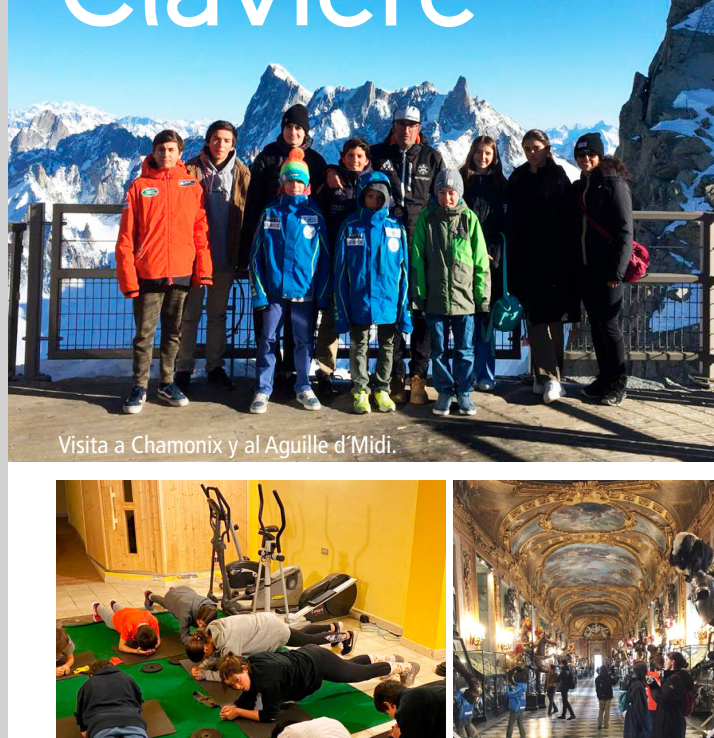
Visita a Chamoni y al Aguille d' Midi.